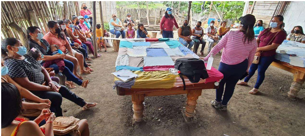
Tabla de validación de materiales de comunicación

Cada una de las actividades propuestas evalúa la apreciación, la atracción, comprensión, identificación, aceptación y los llamados a la acción que generan estos materiales de comunicación; y los cuales nos permite considerar si estos son adecuados o no para influir positivamente en los cambios sociales y de comportamientos de la familia y comunidad, y realizar posteriormente la adaptación y ajustes pertinentes para incluir las observaciones y comentarios de los y las beneficiarios/as