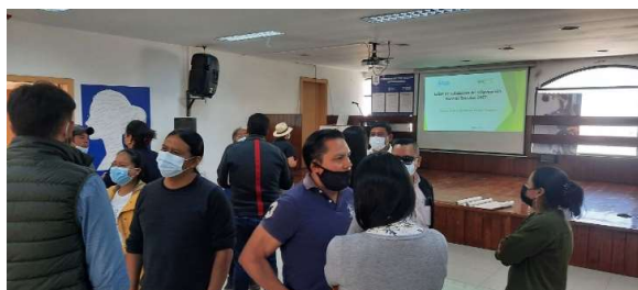
Taller de validación SNET.

Una vez que una forma particular de hacer las cosas se establece en un grupo social, continúa, porque las personas prefieren conformarse antes que sufrir consecuencias sociales si no lo hacen (WFP, 2015). En general, las normas sociales son pautas informales -a menudo implícitas- en lo que la mayoría de la gente acepta y cumple. En sí, las condiciones que mantienen en vigor una norma social están relacionadas con creencias sociales, grupos de referencia y sanciones (USAID, 2019).