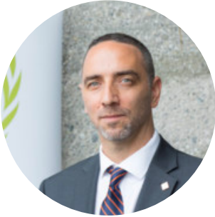
Mariano Brener Coordinador Regional para las Américas de AISS

Solamente el 45% de los países en el mundo disponen de una prestación por desempleo en el marco de programas de seguridad social y nada más el 4% los tienen en el marco de asistencias sociales o transferencias monetarias.