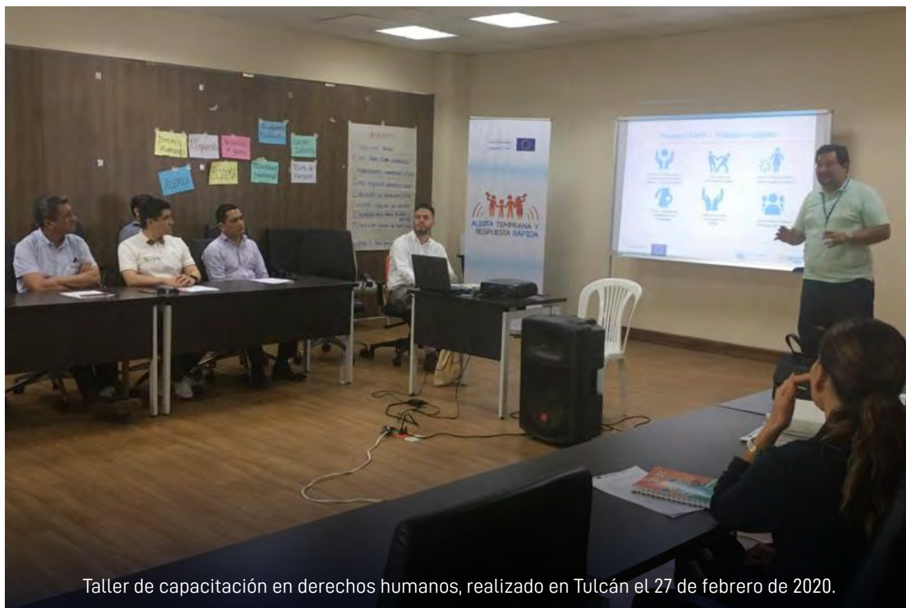
Taller de capacitación en derechos humanos, realizado en Tulcán el 27 de febrero de 2020.

La formación en derechos humanos y en los mecanismos que existen para vigilar su cumplimiento es crucial para el éxito del Sistema de Alerta Temprana y Respuesta Rápida (SART). Por ello, durante la ejecución del proyecto se han llevado a cabo diferentes talleres dirigidos a mejorar la preparación en este campo de los funcionarios de instituciones públicas a nivel nacional y local.